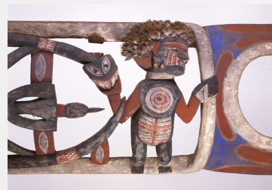
Particolare. Fregio ligneo walik con ornamento arekap. Melanesia.